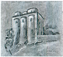
chiesa di San Marco (metà dell'XI secolo)

ISTITUTO COMPRENSIVO A. AMARELLI VIA GRAN SASSO n. 16 - 87067 ROSSANO -